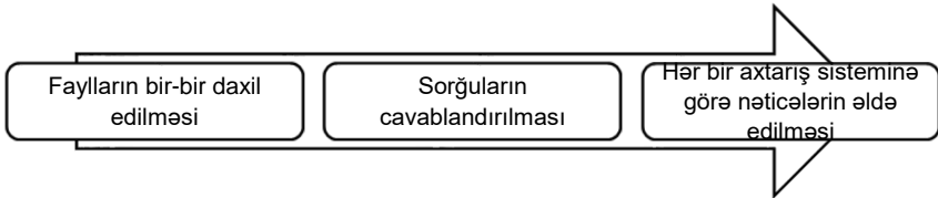
Şəkil 4. Antiplagiat sisteminin iş prinsipi

Ümumilikdə antiplagiat proqramının iş prinsipi aşağıdakı şəkildə təsvir edilir (Şəkil 4):